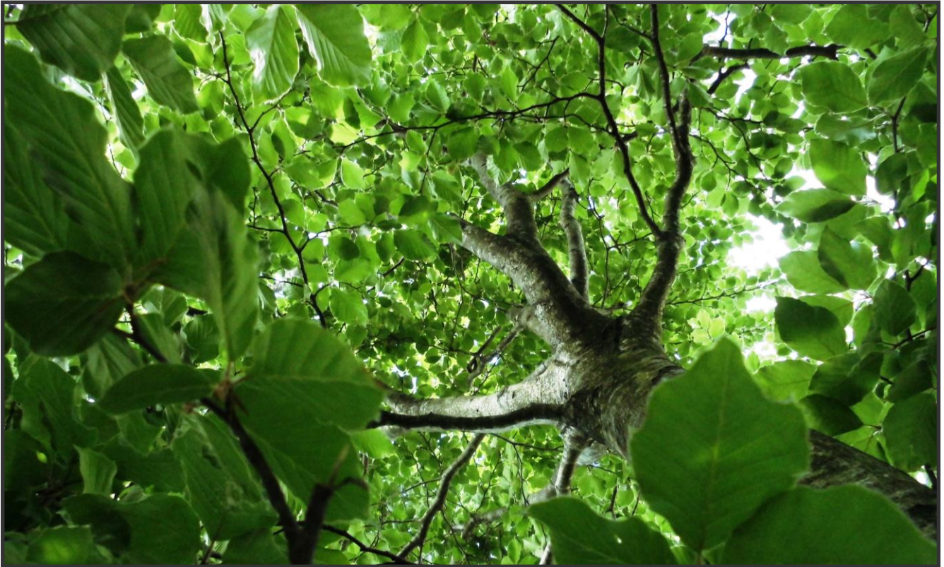
“El túnel de la naturaleza”, 6º curso primaria Colegio Haypo. Primer Premio Categoría B Colegios